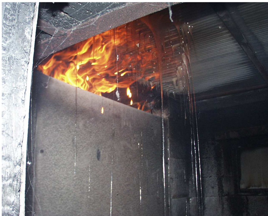
Detail zkušebního vzorku č. 1 při zkoušce (5. min zkoušky)