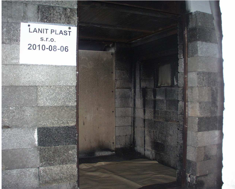
Pohled na zkušební vzorek č. 1 před zkouškou

Po instalaci zkušebního tělesa byly fotograficky zaznamenány pohledy na vzorek č. 1, prakticky identické pohledy na vzorek č. 2 nejsou uváděny: