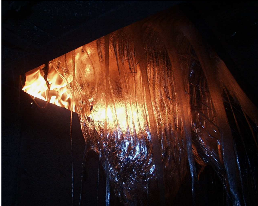
Pohled na zkušební vzorek č. 1 (11. min zkoušky)