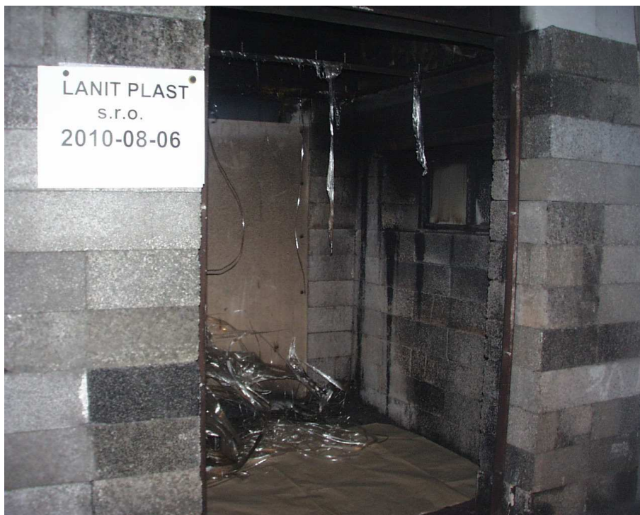
Pohled na zkušební vzorek č. 1 po zkoušce